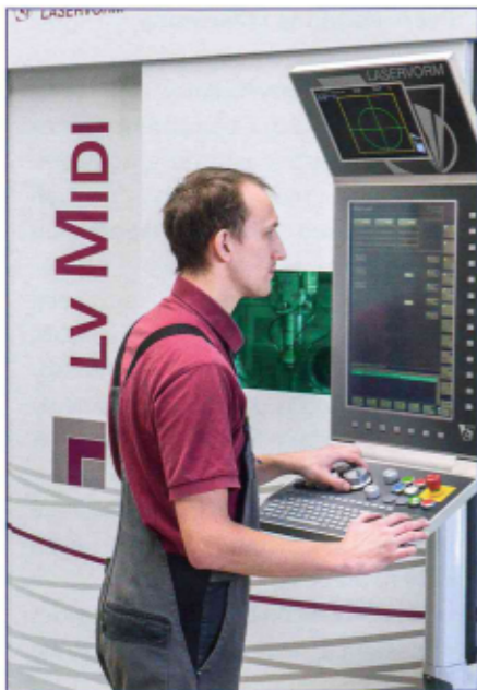
LASERVORM bietet Lohnfertigung auf eigenen Maschinen inhouse an.

The control concept used by LASERVORM for machine-machine communication, human-machine interface, and control-level inte-