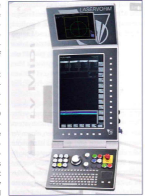
Zentrale Bedienung am Panel – alles greif-, beeinfluss- und steuerbar.

LASERVORM offers contract production on in-house machines.